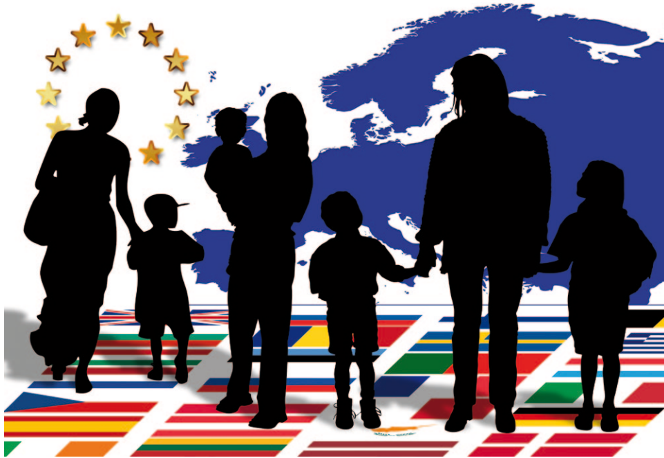
1) Darstellung von „Migration“