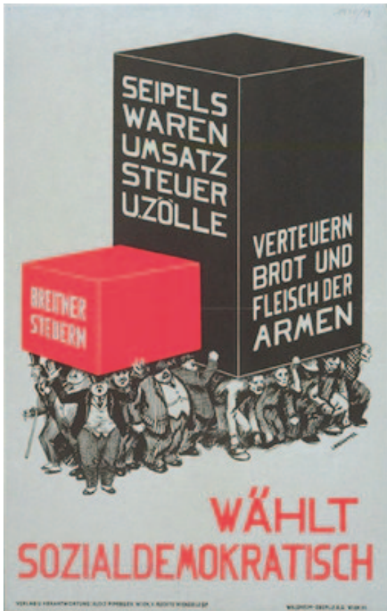
27) Plakat 3 NR-Wahlkampf 1927 http://www.oeaw.ac.at/cmc/kds/b_images/2558012.jpg (20/10/2011)