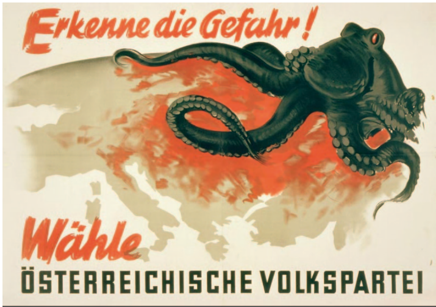
29) Plakat 5 NR-Wahlkampf 1949 Czuray, Jörg; Öhl, Friedrich (2005). CD-Rom „Nationalratswahl. Plakate. Zweite Republik.“ Wien.