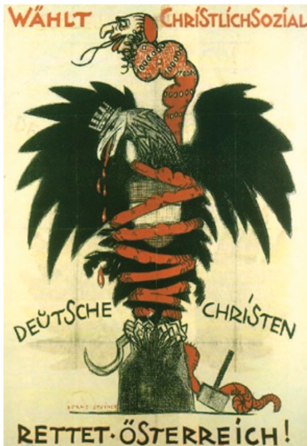
5) „Rettet Österreich“ – NR-Wahlkampf 1930 http://www.oew.ac.at/cmcdks/b_images/1600046.jpg (08/12/2011)

4. Was soll mit dem Plakat erreicht werden?