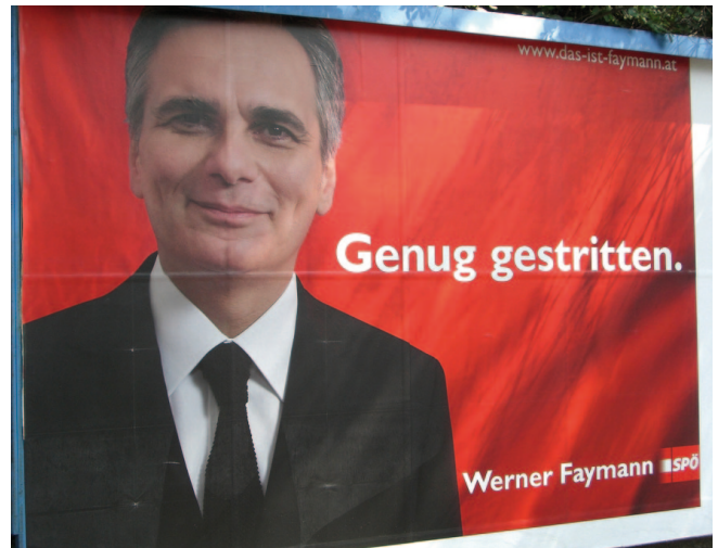
28) Plakat 4 NR-Wahlkampf 2008 http://neuwal.com/wp-content/uploads/2008/08/neuwalspoe-plakat02.jpg (20/10/2011)