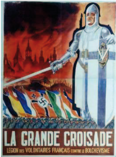
2) Beispiel für ein Propagandaplakat