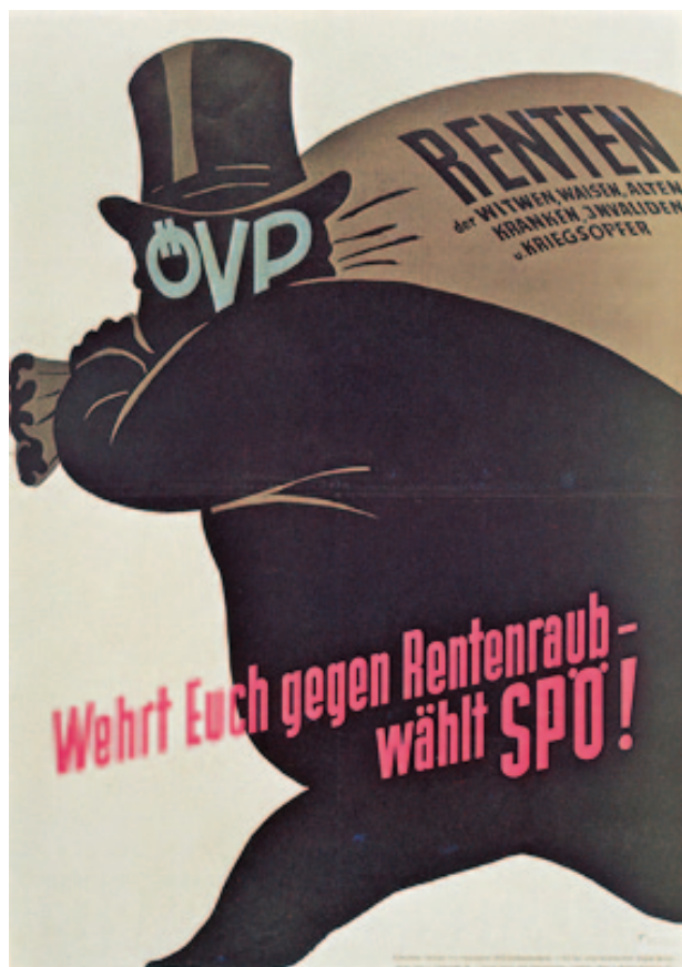
4) NR-Wahlen 1953