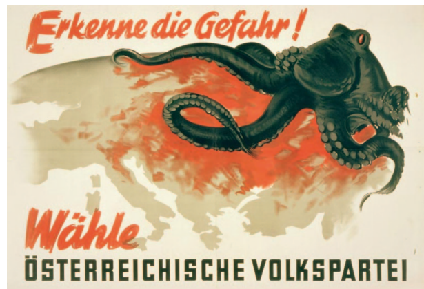
3) NR-Wahlen 1949

Für die Erste Republik und auch noch für die ersten Wahlgänge nach der Wiedererrichtung der Republik galt, dass die Gegner/innen mit drastischen Mitteln verunglimpft wurden. Die Plakate, damals noch von Plakatzeichner/innen entworfen, vermittelten Horrorszenarien, die zeigen sollten, was passiert, wenn die politischen Konkurrent/in-