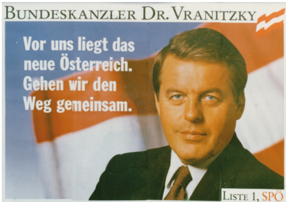
32) Plakat 8 NR-Wahlkampf 1986 http://www.demokratiezentrum.org/wissen/bilder.html?index=836 (20/10/2011)