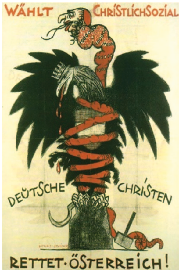
25) Plakat 1 NR-Wahlkampf 1920 http://www.oew.ac.at/cmc/kds/b_images/1600046.jpg (20/10/2011)