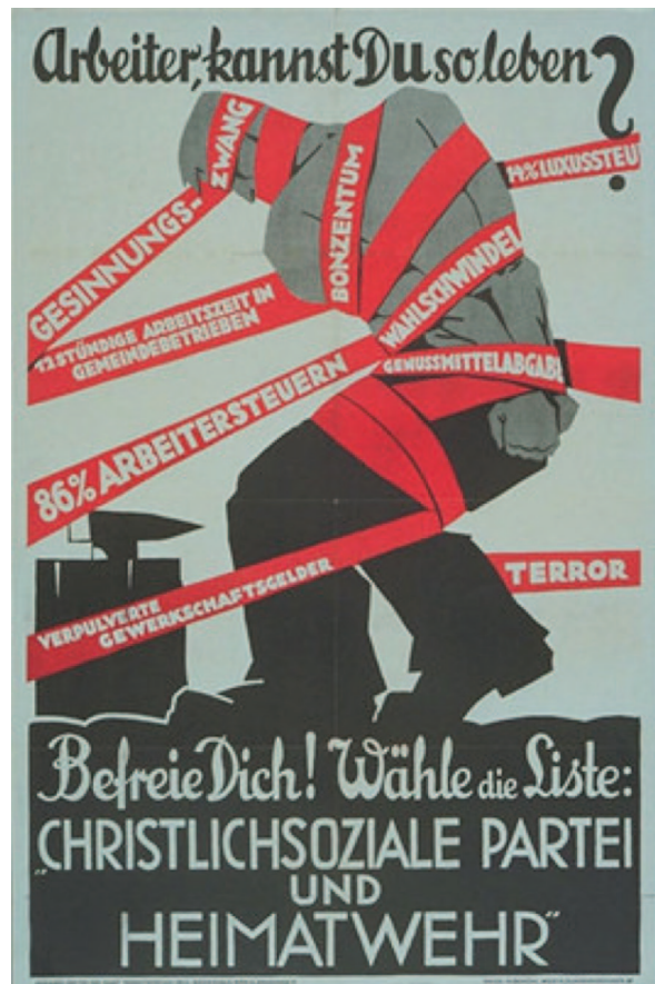
26) Plakat 2 NR-Wahlkampf 1930 http://www.oew.ac.at/cmc/kds/b_images/2558099.jpg (20/10/2011)