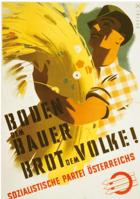
30) Plakat 6 NR-Wahlkampf 1949 Czuray, Jörg; Öhl, Friedrich (2005). CD-Rom „Nationalratswahl. Plakate. Zweite Republik.“ Wien.