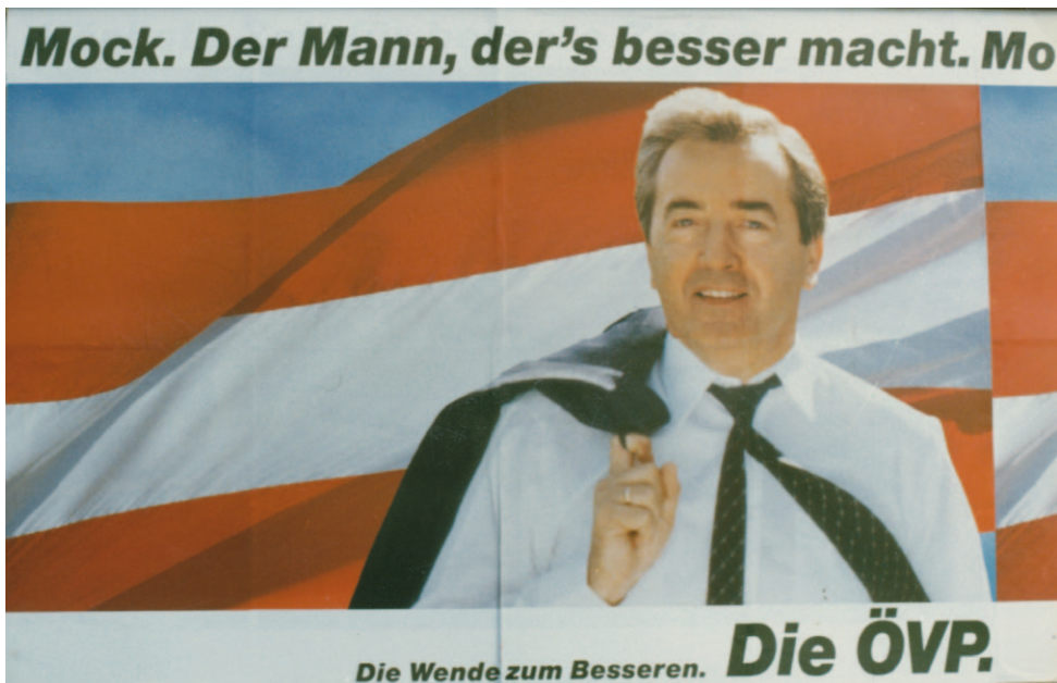
31) Plakat 7 NR-Wahlkampf 1986 http://www.demokratiezentrum.org/wissen/bilder.html?index=837 (20/10/2011)